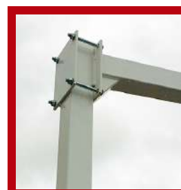
Amarre doble pletina vuelo