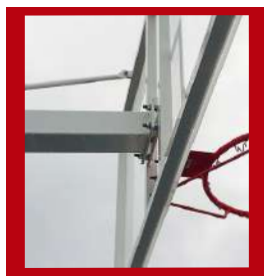
(1) Tuercas de amarre y nivelación

Monoposte y vuelo: 100x100x3mm Tirantes: 30mm