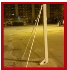
(2) Tirantes inferiores