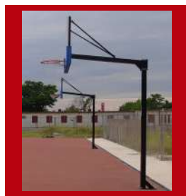
(3) Disponible en color negro